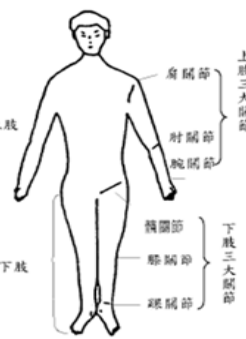
(2)上、下肢關節生理運動範圍一覽表